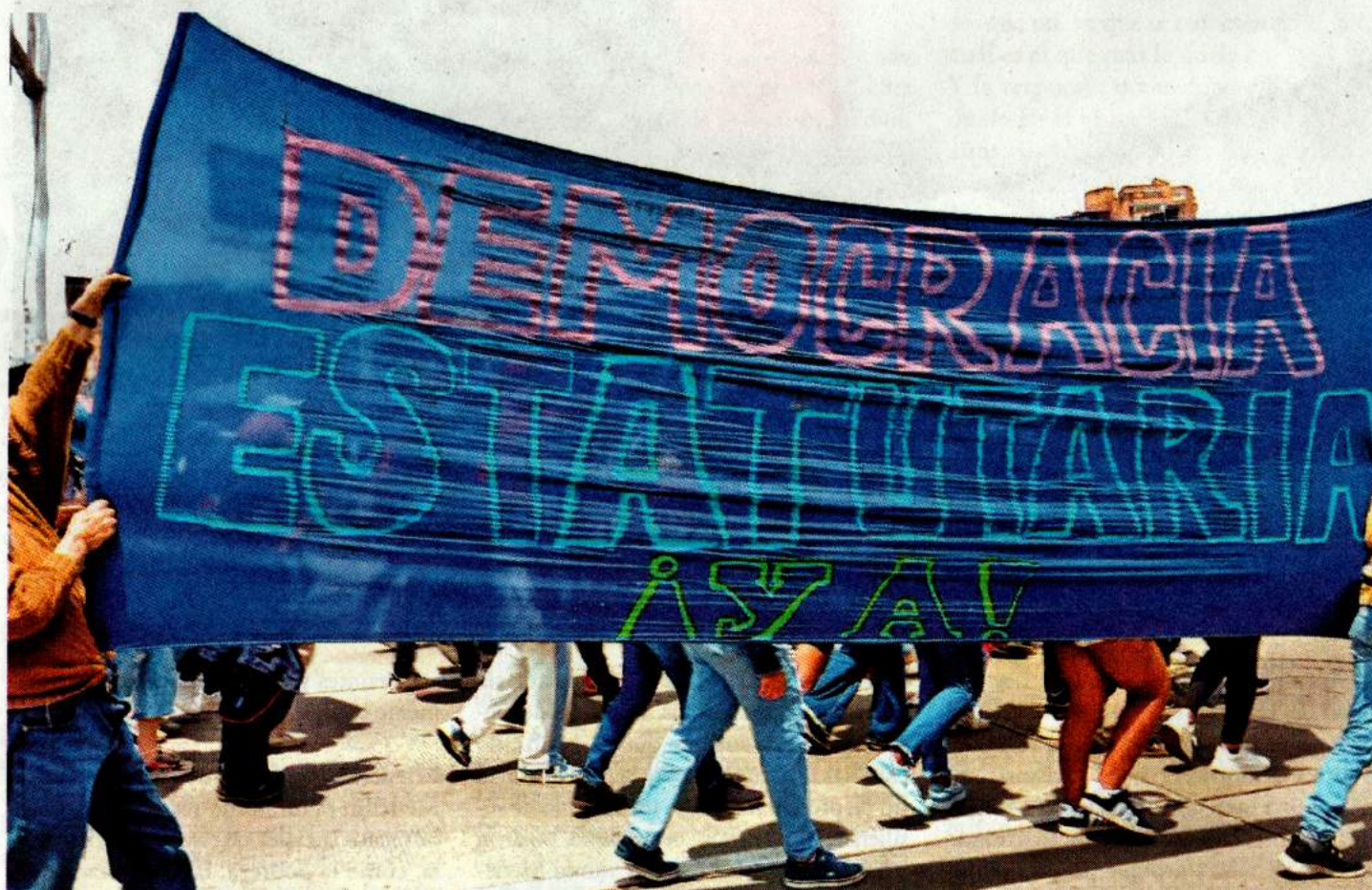
Marcha 11 de abril 2024